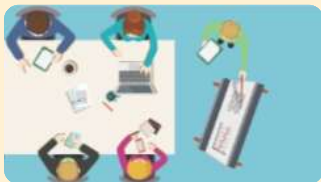
Escritório de Processos

Implementar a transparência ativa em todos os macroprocessos envolvidos da universidade, a exemplo do orçamento e distribuição de vagas docentes;