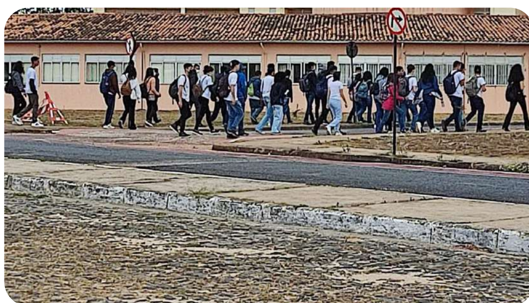
Figura 2. Estudantes do ensino médio em visita ao campus JK, da UFVJM, em Diamantina.