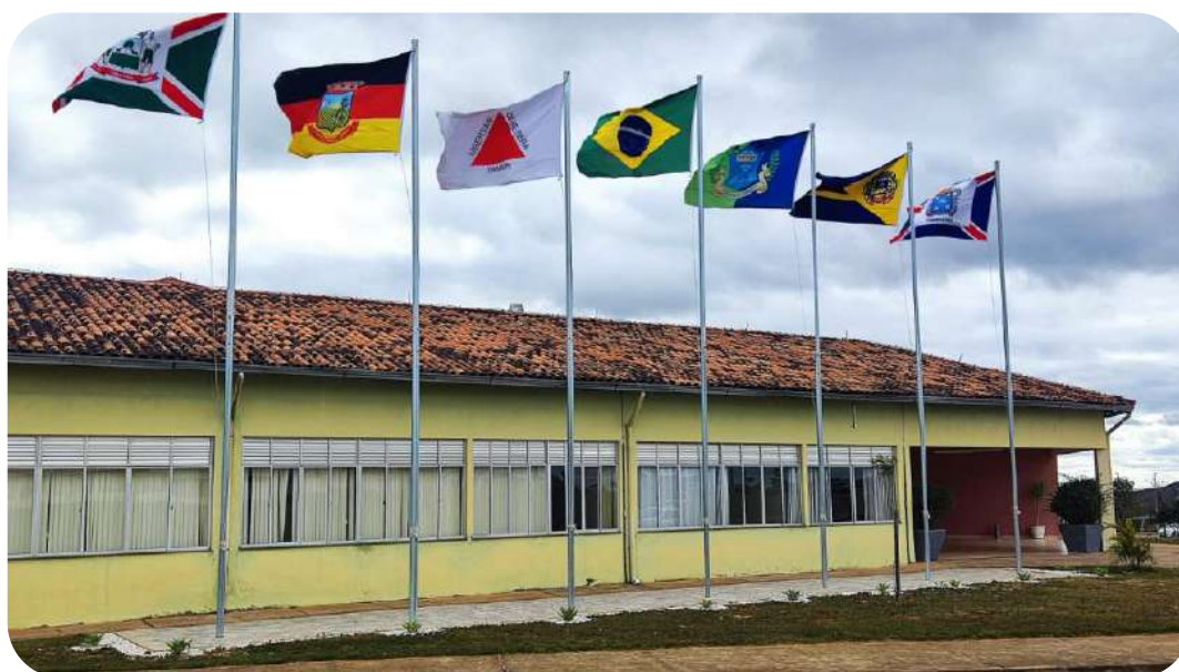
Figura 1. A atual gestão da reitoria fortaleceu a identidade multicampi da UFVJM

Uma proposta robusta, fundamentada nos relatórios de gestão desta casa, em nossos indicadores de desempenho e no Plano de Desenvolvimento Institucional (PDI). Ao longo destes quatro anos de gestão, digo, agosto de 2019 a momento atual, a gestão da reitoria demonstrou conhecimento e competência para administrar a universidade num período de cortes e contingenciamentos no orçamento, além de uma pandemia que durou praticamente dois anos. O sucesso alcançado adveio da inclusão dos campi na gestão administrativa da universidade – isso foi essencial e altamente motivador das pessoas!