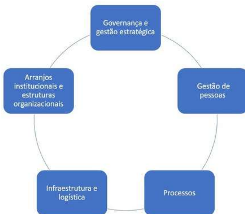
Figura 3. As cinco dimensões do programa TransformaGov.

O programa reúne um conjunto de soluções de curto e médio prazo já desenvolvidas pelo Ministério da Economia para apoiar os órgãos da administração pública federal no desenvolvimento de novas soluções de aprimoramento da gestão. O TransformaGov compreende ações em cinco dimensões, conforme ilustração abaixo: