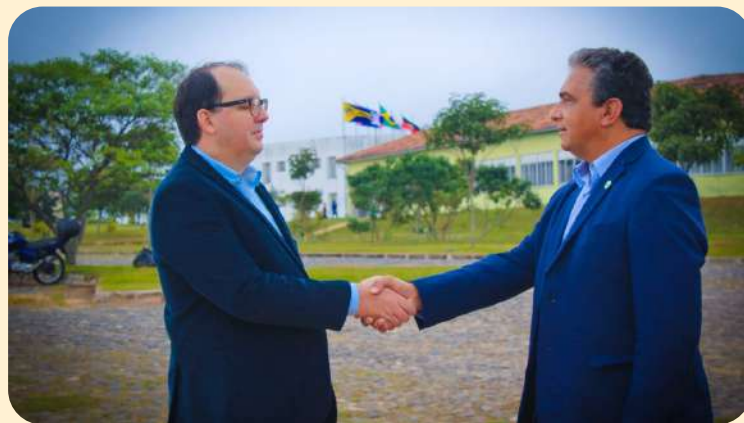
Vista aérea do campus JK