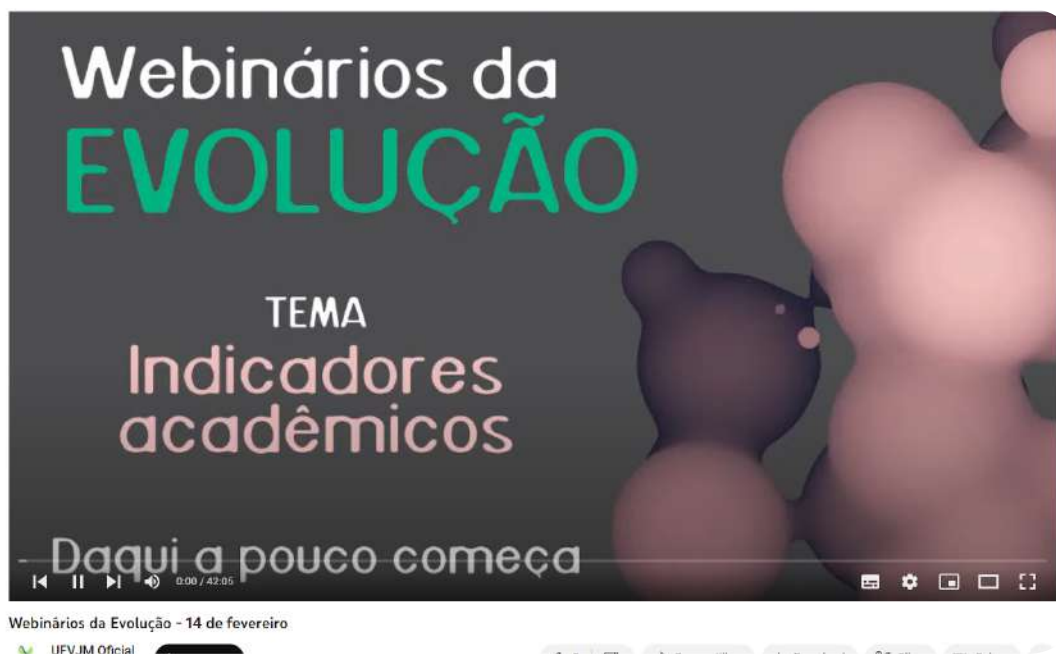
Figura 3. Webnários da evolução marca um momento muito rico de debates visando a modernização da universidade, na perspectiva do estudante do mundo contemporâneo.

A proposta de reestruturação das unidades organizacionais da reitoria encontra-se registrada nos Processos SEI 23086.000191/2023-15 e 23086.005062/2022-24 e envolve os setores do gabinete da reitoria, das pró-reitorias de apoio e finalísticas e dos órgãos suplementares.